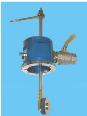
Sistema a cerniera per i DN: 160-180-200-225 SDR11