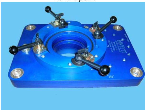
Sistema ad espansione per DN: 90-110-125 SDR 11